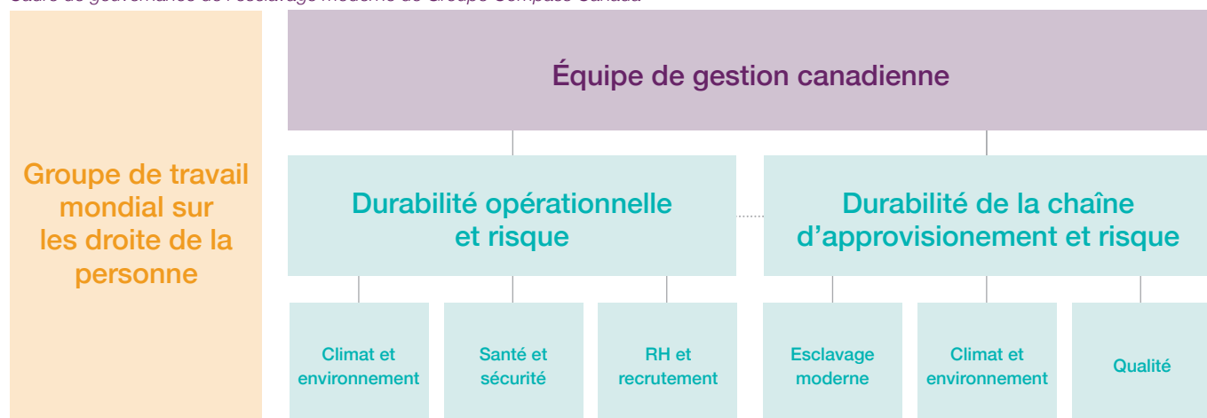
Cadre de gouvernance de l'esclavage moderne de Groupe Compass Canada

La figure suivante décrit notre cadre de gouvernance en ce qui concerne l'identification et l'atténuation des risques associés au travail forcé et au travail des enfants dans notre chaîne d'approvisionnement.