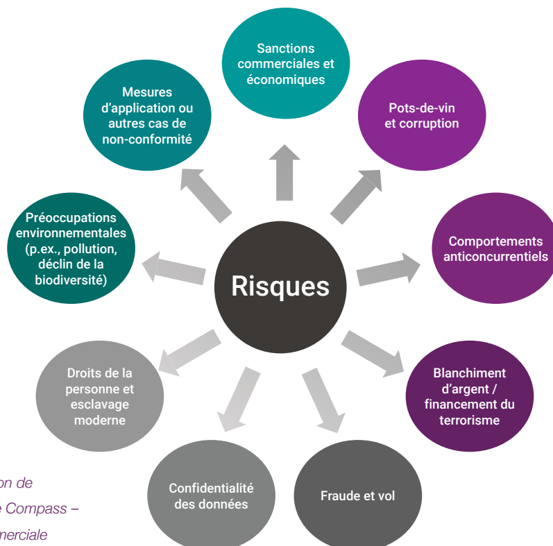
Figure 1 : Politique d'évaluation de l'intégrité des tiers du Groupe Compass – Risques liés à l'intégrité commerciale

La mise en œuvre de la PEIDT a été soutenue par une formation pour les membres de notre équipe d'approvisionnement afin qu'ils comprennent pleinement les risques potentiels et les étapes d'escalade requises pour les aborder. À l'avenir, l'évaluation PEIDT et le processus d'intégration et d'examen de Sedex formeront les éléments clés de l'évaluation des risques des fournisseurs du Groupe Compass Canada.